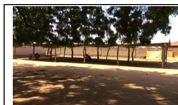
Vor dem Umbau

Hier ein paar Bilder vom Bau des Freizeitentrums: