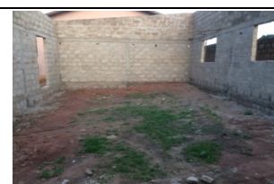
Während des Umbaues