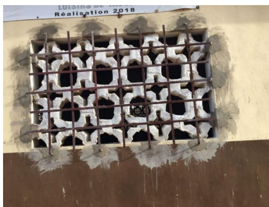
Sicherung der Fensteröffnungen

Wir halten Euch über die weiteren Schritte auf dem Laufenden.