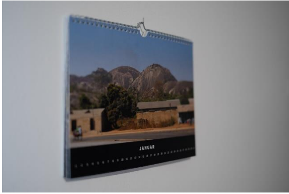
DIN A4 Bilderkalender