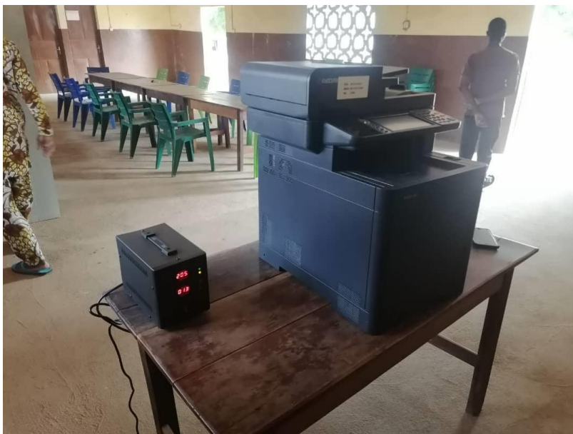
Neuer Drucker im Recreation-Center

Seitens der Schule, bzw. des Vorstands des vor Ort unterstützenden Komitees gab es Anfragen für zukünftige Projekte, die der Verein, neben der Finanzierung der Lehrergehälter, unterstützen könnte. Dabei handelt es sich u.a. um eine Mitfinanzierung der täglichen Mittagessen für die Schüler. Der Vorstand ist derzeit im engen Austausch mit der Schule, um detailliertere Informationen, Kosten und Kennzahlen zu erhalten.