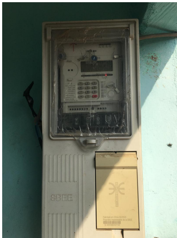
EUV nach dortigem Standard installiert