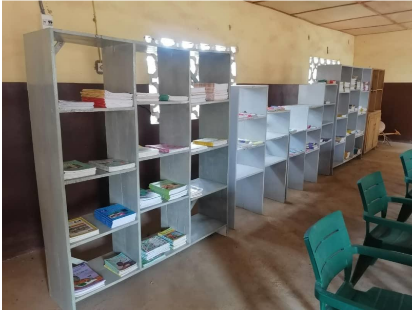
Möblierung und viele neue Schulbücher im Recreation-Center